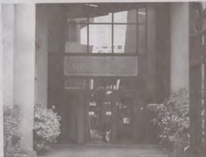
«Terra Ltd» est présent dans l'actionariat du groupe Swan à hauteur de 33 %.

En outre, Terra Finance suit de près les fluctuations des taux d'intérêts ainsi que